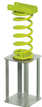
Perustusosa sisältyy toimitukseen