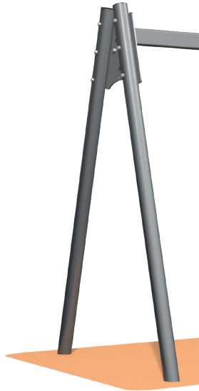
0292 KEINURUNKO, TERÄSJALAT